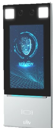
Falra történő telepítés